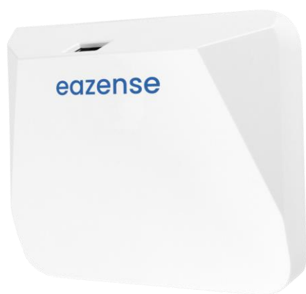
Produktbild av EaZense™

Under 2021 utvecklades en offline-version av EaZense i samarbete med den nederländska partnern Croonwolter & Dros, specialanpassad för kriminalvården. Bolaget ser en stor efterfrågan för denna tjänst globalt. Under det tredje kvartalet erhölls ett patent för delar av Bolagets radarsensor i USA och Raytelligence passerade sitt försäljningsmål om 1 000 enheter. I samband med detta sattes ett ytterligare mål att uppnå försäljning motsvarande minst 10 000 enheter år 2022. Raytelligence flyttade under året till en större lokal i Halmstad och etablerade flera nya partnerskap globalt. Bolaget bedömer att de därigenom har främjat förutsättningarna för 2022 års uppskalning och expansion, samt försäljning.