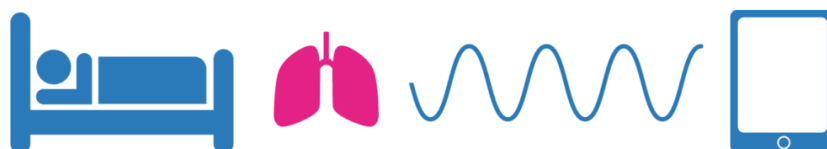
Komfort, säkerhet och integritet med EaZense™

Utöver hälsosektorn finns möjlighet för Bolaget att leverera teknik baserat på sensorn till andra kunder som är i behov av att kunna övervaka personer i arbete. Bolagets sensorteknik inom detta område kan bidra till en förhöjd säkerhet på t.ex. byggarbetsplatser.