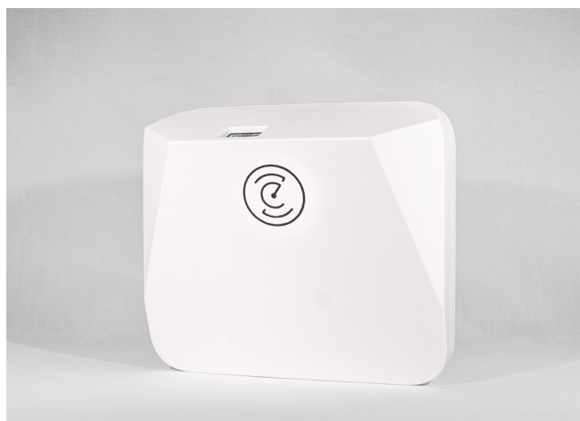
Bolagets radarsensor EaZense™

Utöver hälsosktorn finns möjlighet för Bolaget att leverera teknik baserat på sensorn till andra kunder som är i behov av att kunna övervaka vitalparametrar. Bolaget har inlett kontakt med ett multinationellt företag intresserade av övervakning av vitalparametrar hos personer som utför säkerhetskritiska arbetsuppgifter. Bolagets sensorteknik inom detta område kan bidra till en förhöjd säkerhet på byggarbetsplatser.